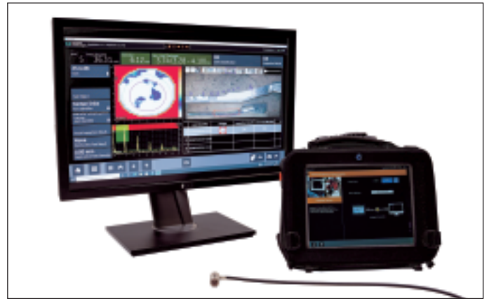
スポット溶接の検査において、Krautkrämer SpotVision は簡単に確実なフェーズドアレイソリューションです。

自動車産業向けカスタマイズソリューションは、簡単で使いやすく、素早い判定を提供します。また、装置1台で複数のアプリケーションに対応できるため、利便性がよく、検査員のトレーニング時間が短縮できます。