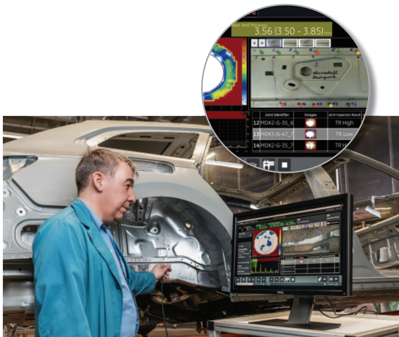
ユーザーインターフェースは直感的

Krautkrämer SpotVision は、評価プロセスの改善と誤検出の低減により、生産性向上とスクラップ削減によるコスト低減を実現します。