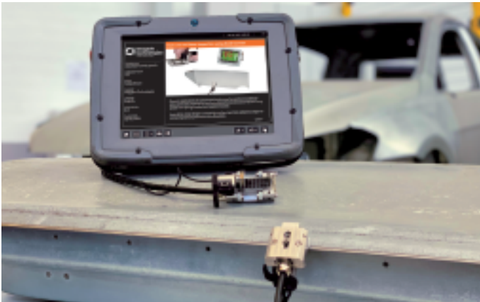
Krautkrämer Bond Scanner は、構造用接着剤で接合された部品を迅速かつ簡単に検査できます。

いずれの検査ソリューションも、Krautkrämer Mentor UT フェーズドアレイ超音波探傷器との組み合わせで使用します。特長として、検査ワークフローにより、プローブの選択、キャリブレーションからレポート作成まで、装置のセットアップ手順を示すことで検査員は簡単にプロセスに準じた検査を実行できます。