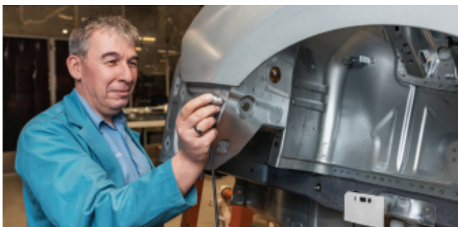
Krautkrämer SpotVision は、実用的で取扱いが容易なプローブ